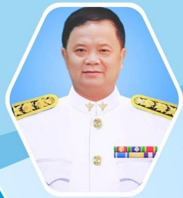
นายณอม ฝิวหอม รักษาราชการแทนสาธารณสุข อำเภอなたล